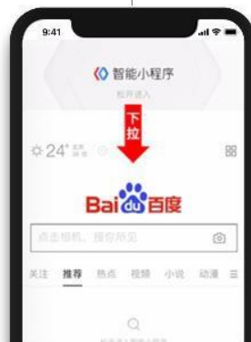
(最近使用/大家都在用)