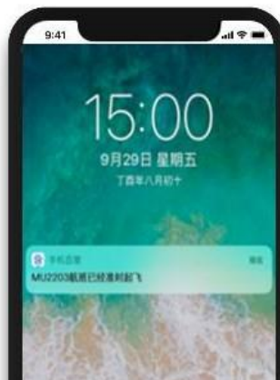
重访入口-服务消息